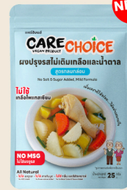
สูตรกลมกล่อม Mild Formula 25 39 กรัม / g บาท / THB