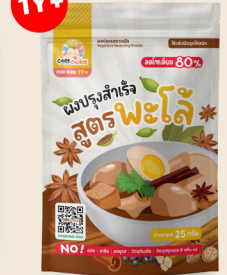
ผงปรุงสำเร็จ สูตรพะโล้ Palo Flavor for Kids 25 39 กรัม / g บาท / THB