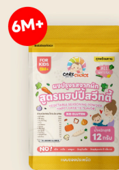
แฮปปี้สวีทตี้ Happy Sweetie Flavor for Kids 12 25 กรัม / g บาท / THB