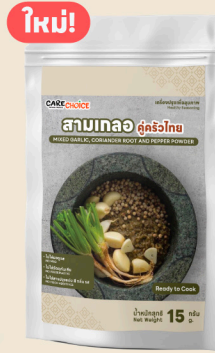
สามเกลอ คู่ครัวไทย Mixed Garlic, Coriander Root and Pepper Powder