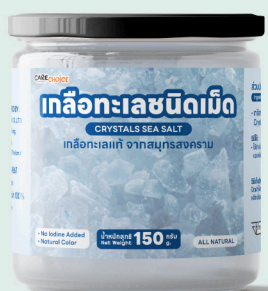
เกลือทะเลชนิดเม็ด Crystal Sea Salt