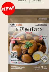
พะโล้ สูตรโบราณ Palo Flavor 35 39 กรัม / g บาท / THB