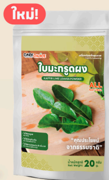
ใบมะกรูดผง Kaffir Lime Leaves Powder