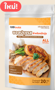
ซอสปรุงรส สำหรับหมักเนื้อ Meat Tenderizer Seasoning Sauce