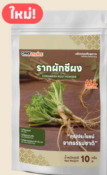
รากผักชี Coriander Root Powder