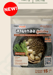
สามเกลอ คู่ครัวไทย Mix Garlic, Coriander Root & Pepper Powder 15 39 กรัม / g บาท / THB