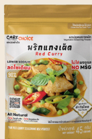
พริกแกงเผ็ด Thai Red Curry Mix Recipe 45 39 กรัม / g บาท / THB