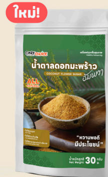
น้ำตาลดอกมะพร้าว Coconut Flower Sugar