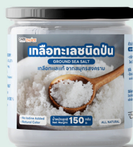
เกลือทะเลชนิดป่น Ground Sea Salt