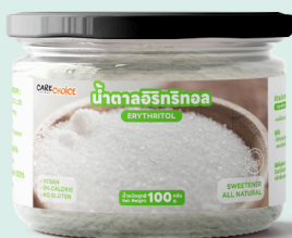
น้ำตาลอริทริทอล Erythritol