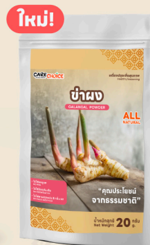
ข่าผง Galangal Powder