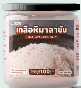
เกลือหิมาลัย Himalayan Pink Salt