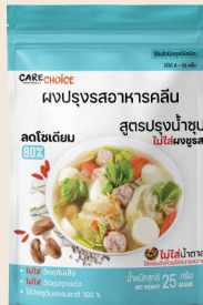
สูตรปรุงน้ำซุป Clear Soup Flavor 25 39 กรัม / g บาท / THB