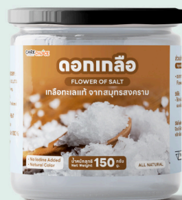
ดอกเกลือ Flower of Salt