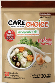
สูตรดั้งเดิม Original Flavor 30 25 กรัม / g บาท / THB