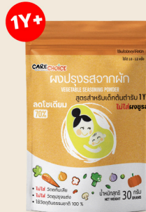
เด็กต้นตำรับ Original Flavor for Kids 30 35 กรัม / g บาท / THB