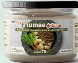
สามเกลอคู่ครัวไทย Mixed Garlic, Coriander Root and Pepper Powder