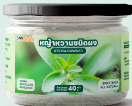
หญ้าหวานชนิดผง Stevia Powder