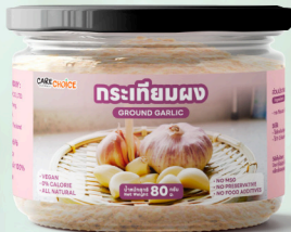
กระเทียมผง Garlic Powder