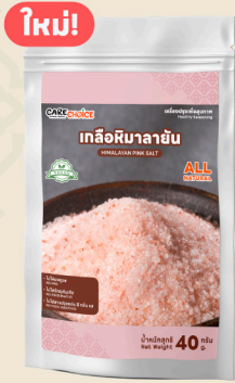
เกลือหิมาลายัน Himalayan Pink Salt