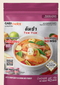
ต้มยำ Tom Yum Hot & Sour Soup Mix Recipe 45 39 กรัม / g บาท / THB