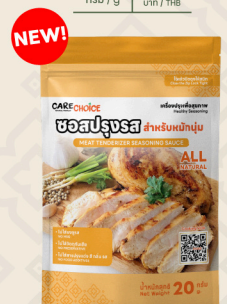
ซอสปรุงรส สำหรับหมักเนื้อ Meat Tenderizer Seasoning Sauce 20 39 กรัม / g บาท / THB