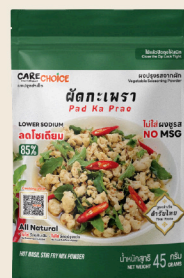
ผัดกะเพรา Pad Ka Pao Hot Basil Stir Fry Mix Recipe 45 39 กรัม / g บาท / THB