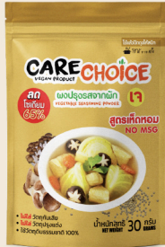
สูตรเห็ดหอม Shiitake Flavor 30 25 กรัม / g บาท / THB