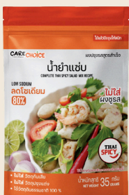
น้ำยำแซบ Thai Spicy Salad Mix Recipe 35 39 กรัม / g บาท / THB