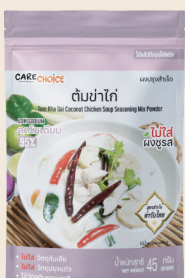
ต้มข่าไก่ Tom Kha Gai Coconut Chicken Soup Mix Recipe 45 39 กรัม / g บาท / THB