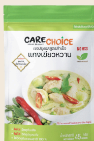
แกงเขียวหวาน Green Curry Mix Recipe 45 39 กรัม / g บาท / THB