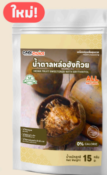
น้ำตาลหล่ออังกี้วย Monk Fruit Sweetener with Erythritol