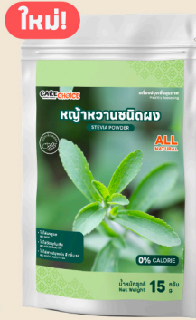
หญ้าหวานชนิดผง Stevia Powder