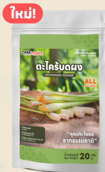
ตะไคร้บดผง Lemongrass Powder