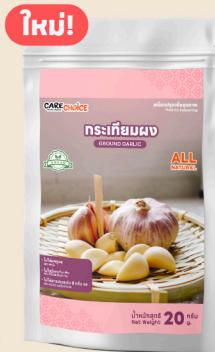
กระเทียมผง Ground Garlic