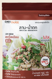
ลาบ - น้ำตัก Laab - Namtok Mix Recipe 35 39 กรัม / g บาท / THB