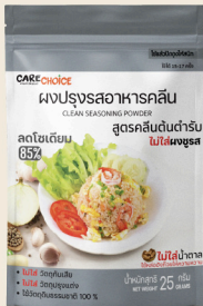
สูตรคลีนต้นตำรับ Original Clean Flavor 25 39 กรัม / g บาท / THB