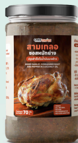
สามเกลอซอสหมักย่าง Mixed Garlic, Coriander Root and Pepper in Coconut Oil