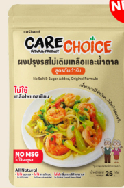
สูตรต้นตำรับ Original Formula 25 39 กรัม / g บาท / THB