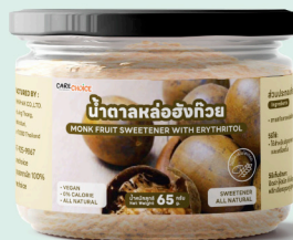
น้ำตาลหล่อฮังกวน Monk Fruit Sweetener with Erythritol