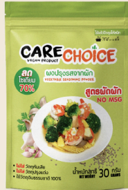
สูตรผัดผัด Stir-Fry Flavor 30 25 กรัม / g บาท / THB