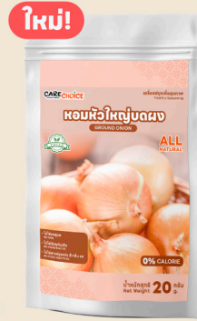
หอมหัวใหญ่บดผง Ground Onion